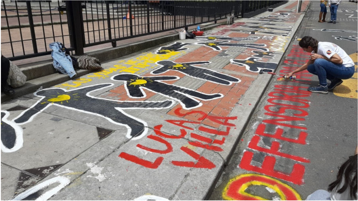
Crédits : Bogotá, mai 2022 – Sede Defensoria del Pueblo de Colombia - Tiphaine Duriez